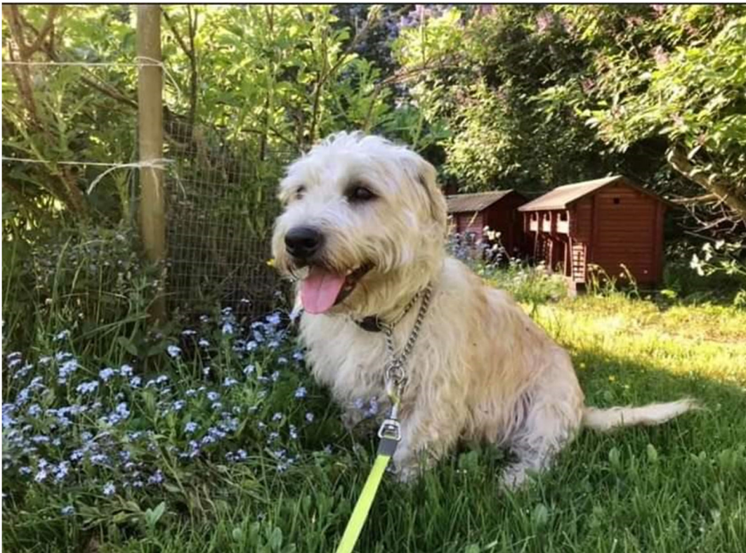
Hugo, med en alldeles egen personlighet!