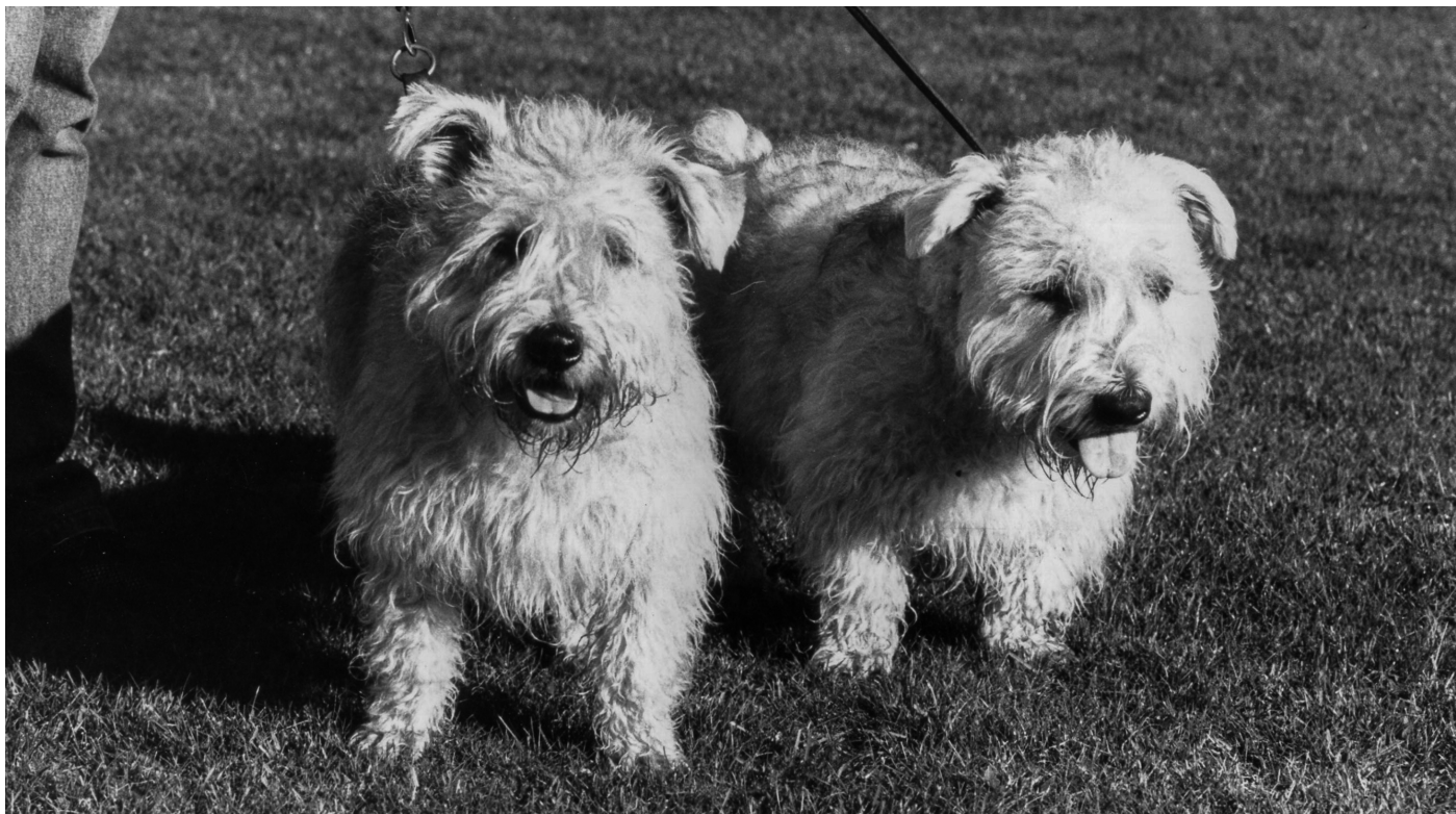
Eamon och Sinead