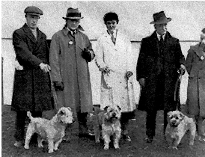
Glennar på Irland 1933