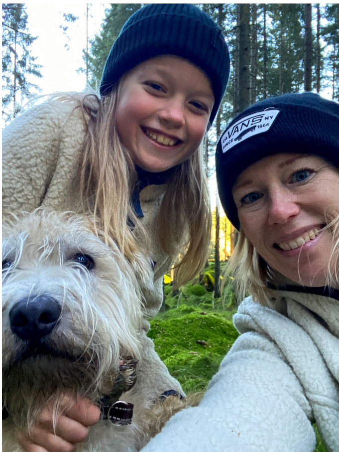
Gwen med matte och lillmatte

- Det är ju en terrier, så Hamlet är envis som synden. Har man en gång sagt att han får vara i soffan så är han i soffan. Men han är intelligent och förstår att han får vara i den ena soffan och inte i den andra.