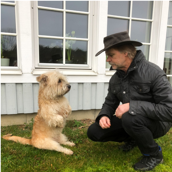
Hamlet med husse