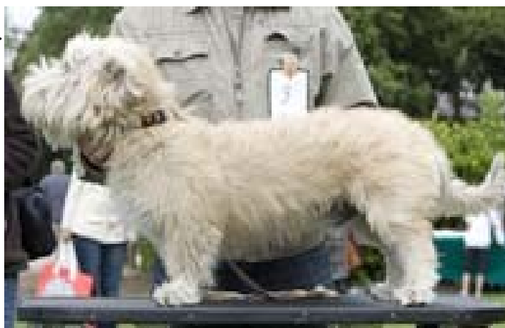
Irish Glen of Imaal terrier 2010

De problem vi alltjämt ser idag, är en tendens till för stora och tunga hundar, vilket fortfarande begränsar hundens ursprungliga funktioner. Och vi finner en begynnande tendens till att skullbredden minskar samt att mankhöjden ökar något,