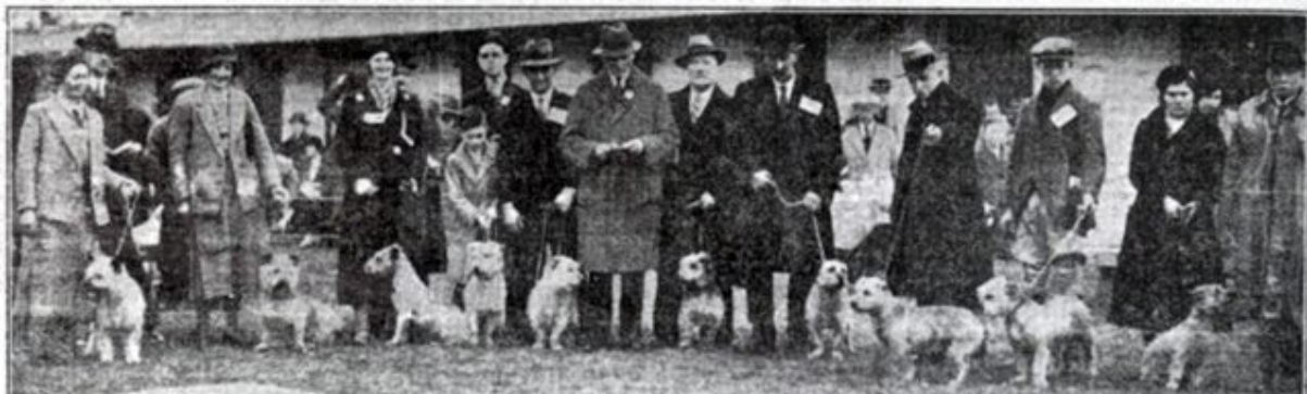
Första utställningen för Irish Glen of Imaal, 1934

Terriern skulle fungera som en allt-i-allo-hund, med uppgift att vakta gården mot inkräktare och hålla skadedjuren borta bl a kanin, räv och råtta . Men grytjakt på grävling var deras specialitet, de användes även för jakt på utter vilket utvecklade en särskild skicklighet att jaga i vatten. Intresset i att både gräva efter småvilt och vistas vatten finns fortfarande kvar som en rastypisk egenskap och uppmuntras i dagsläge.