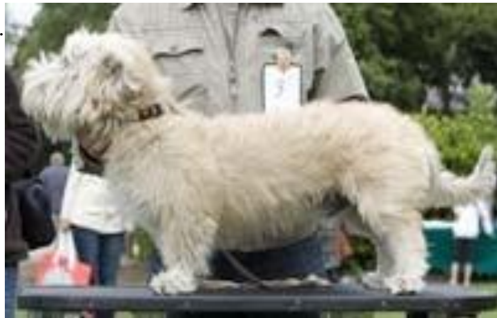
Irish Glen of Imaal terrier 2010

De problem vi alltjämt ser idag, är en tendens till för stora och tunga hundar, vilket fortfarande begränsar hundens ursprungliga funktioner. Och vi finner en begynnande tendens till att skullbredden minskar samt att mankhöjden ökar något, observera att detta är en iakttagelse, som vi ser internationellt och som vi tycker bör noteras.